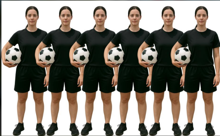
Todas as imagens se referem a gandulas femininas e masculinos.