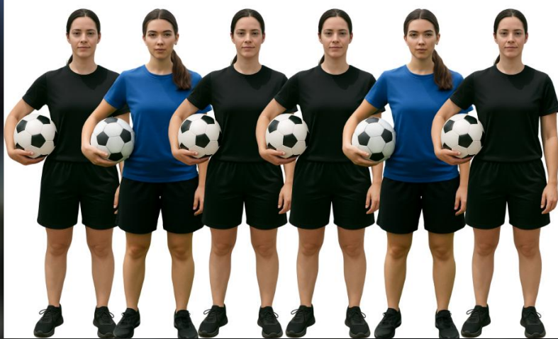
Todas as imagens se referem a gandulas femininas e masculinos.